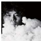
西浦 謙助 相対性理論<ミュージシャン>