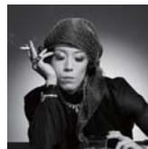
ギャランティーク和恵 <歌手>