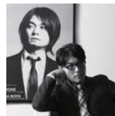
堀込 高樹 キリンジ<ミュージシャン>