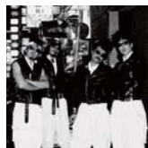
新宿金蠅 <ミュージシャン>