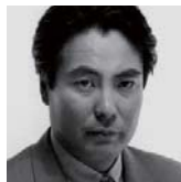
大沢 在昌 <小説家>