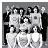
デリシャスウィーツ