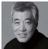
柄本 明 <俳優>