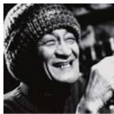
内藤 陳 <タレント>